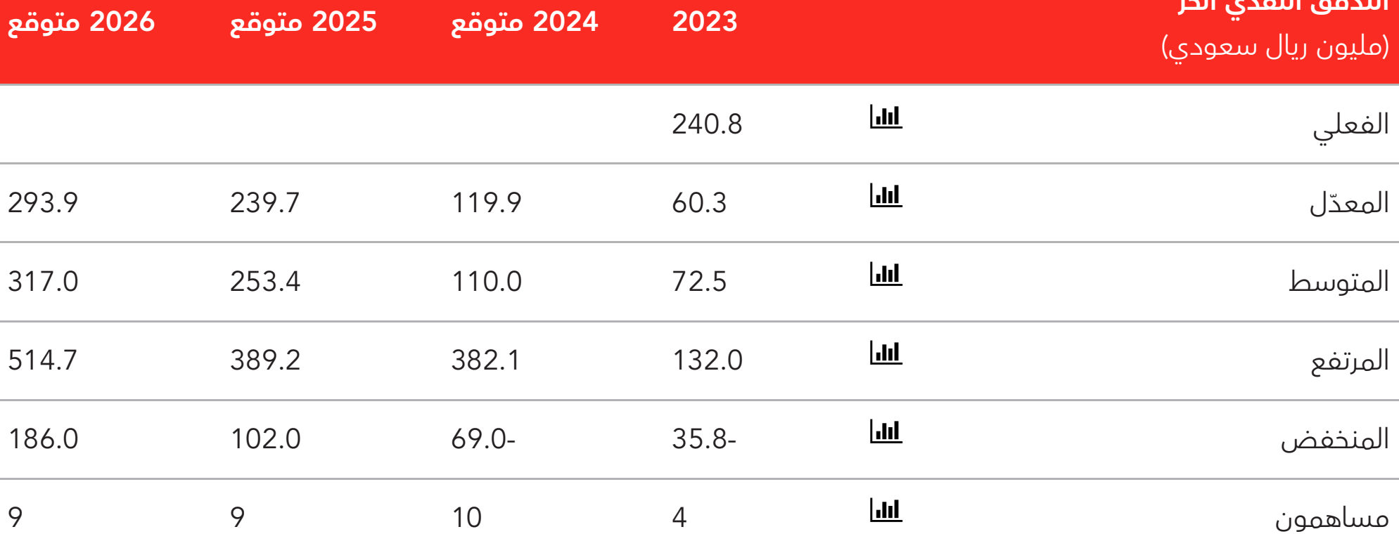
التدفق النقدي الحر (مليون ريال سعودي, المتوسط)