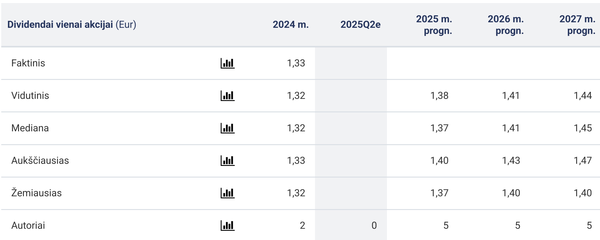
Dividendai vienai akcijai (Eur, mediana)