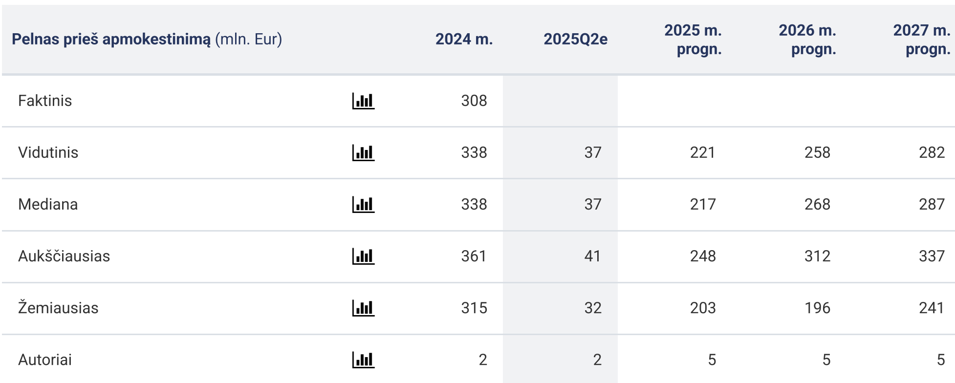
Pelnas prieš apmokestinimą (mln. Eur, mediana)