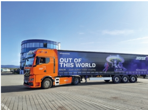
Truck: 38% des Umsatzes