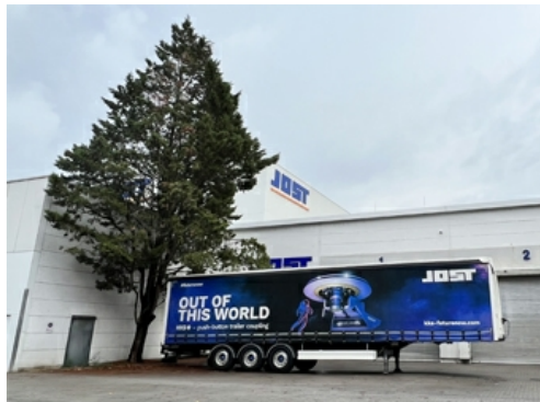
Trailer: 41% des Umsatzes