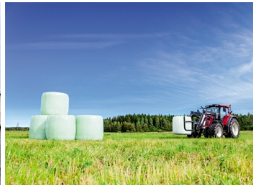
Tractor: 21% des Umsatzes