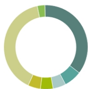
Aktionärsstruktur Oktober 2024